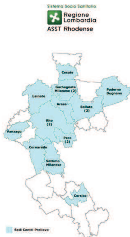
Centri Prelievo Territoriali - Area Corsico - Garbagnate/Bollate - Rho

A titolo informativo nella figura seguente si riporta la dislocazione dei centri prelievi dell'ASST sul territorio.